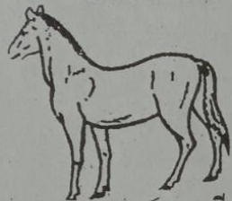
ဝဲတ် မးမိတ်