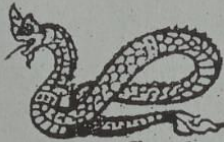
ဝဲတ် မးဝဲ