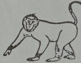
ဝဲတ် ဝဂ္ဂ