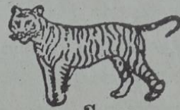
ပိတ် ဃာတ်