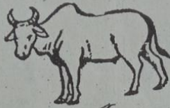
ဝဲတ် ဝဂ္ဂ