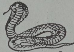
ဝဲတ် မးစံ