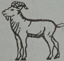
ဝဲတ် မးမေ