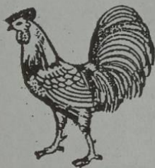
ဝဲတ် ဝဂ္ဂ