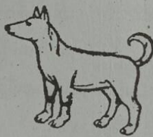
ဝဲတ် ဝဂ္ဂ