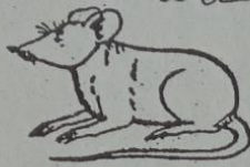
ဝဲတ် ဃာတ်